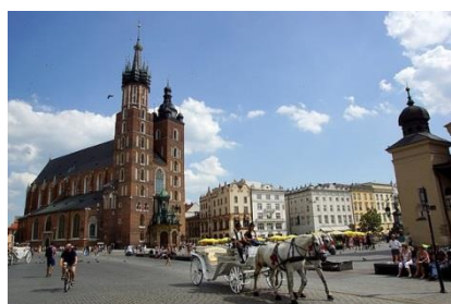
Kraków z dzielnicą Kazimierz WTOREK

*młodzież szkolna, studenci, emeryci ** dzieci do lat 14