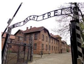
Wadowice - Oświęcim ŚRODA (wycieczka dostępna w 5 terminach)

*młodzież szkolna, studenci, emeryci ** dzieci do lat 14