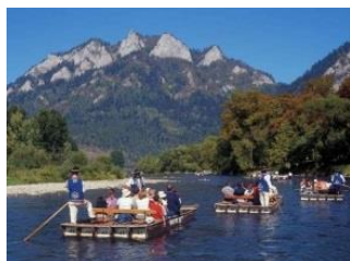
Polski Spływ Przełomem Dunajca CODZIENNE